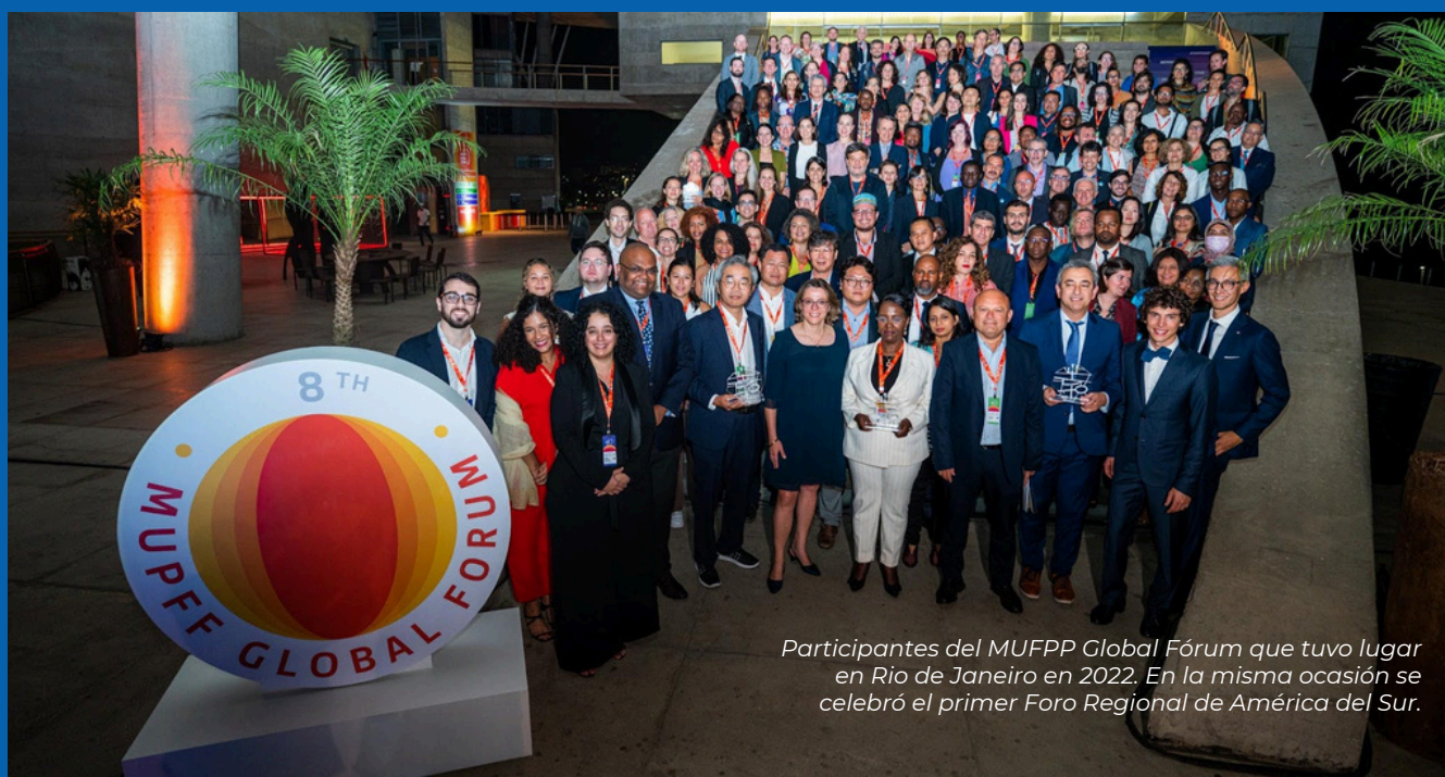
Participantes del MUFPP Global Fórum que tuvo lugar en Rio de Janeiro en 2022. En la misma ocasión se celebró el primer Foro Regional de América del Sur.