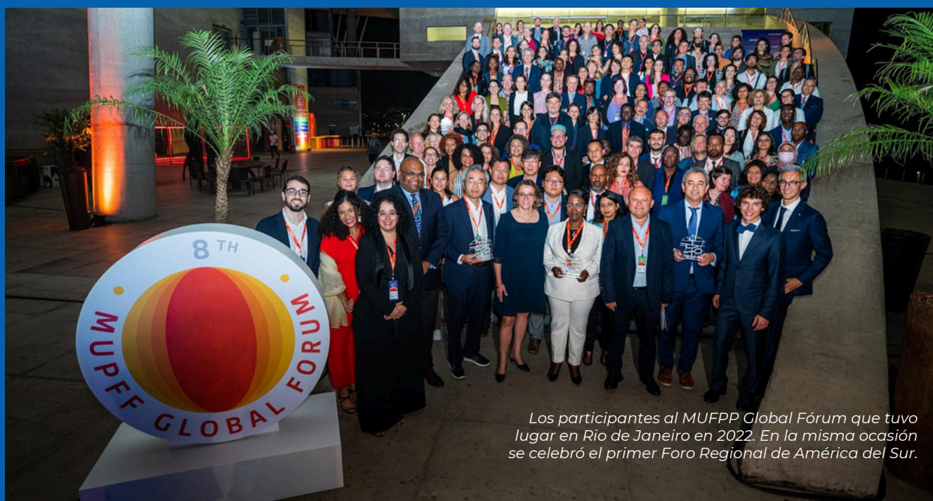
Los participantes al MUFPP Global Fórum que tuvo lugar en Rio de Janeiro en 2022. En la misma ocasión se celebró el primer Foro Regional de América del Sur.