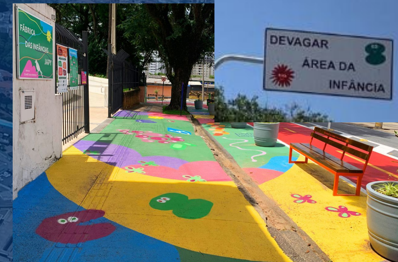
Área da Infância (alargamento de calçadas, segurança viária, caminhabilidade, elementos lúdicos) Área de la Infancia (ensanchamiento de aceras, seguridad vial, accesibilidad peatonal)

Fábrica das Infâncias Japy, um equipamento cultural com foco nas infâncias Fábrica de las Infancias Japy, un equipamiento cultural con enfoque en la infancia