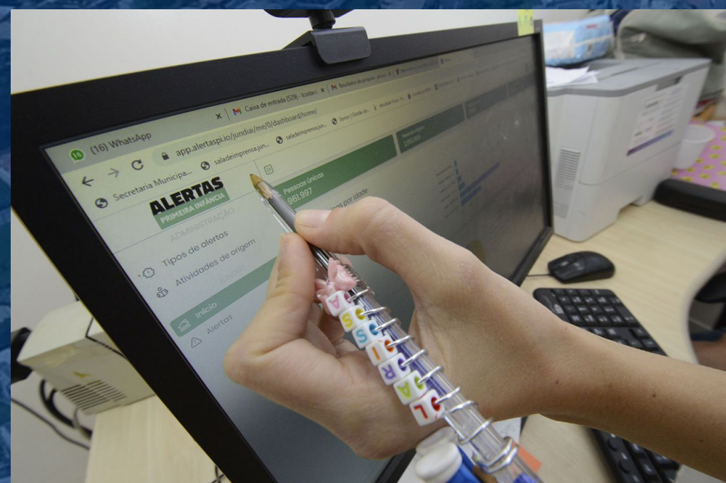
Sistema Integrado Alertas da Infância Sistema Integrado de Alertas de la Infancia