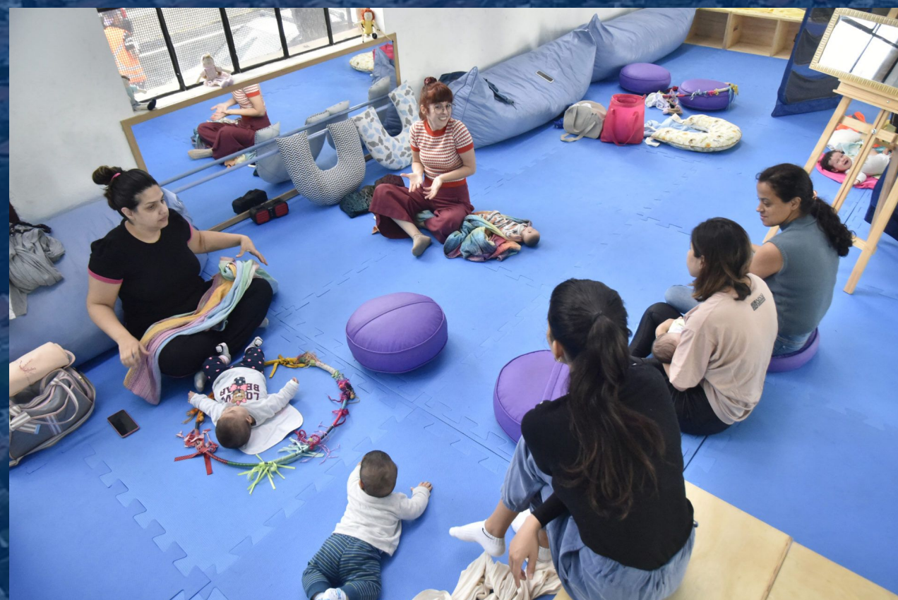
Vivência entre cuidadores e bebês Experiencia entre cuidadores y bebés