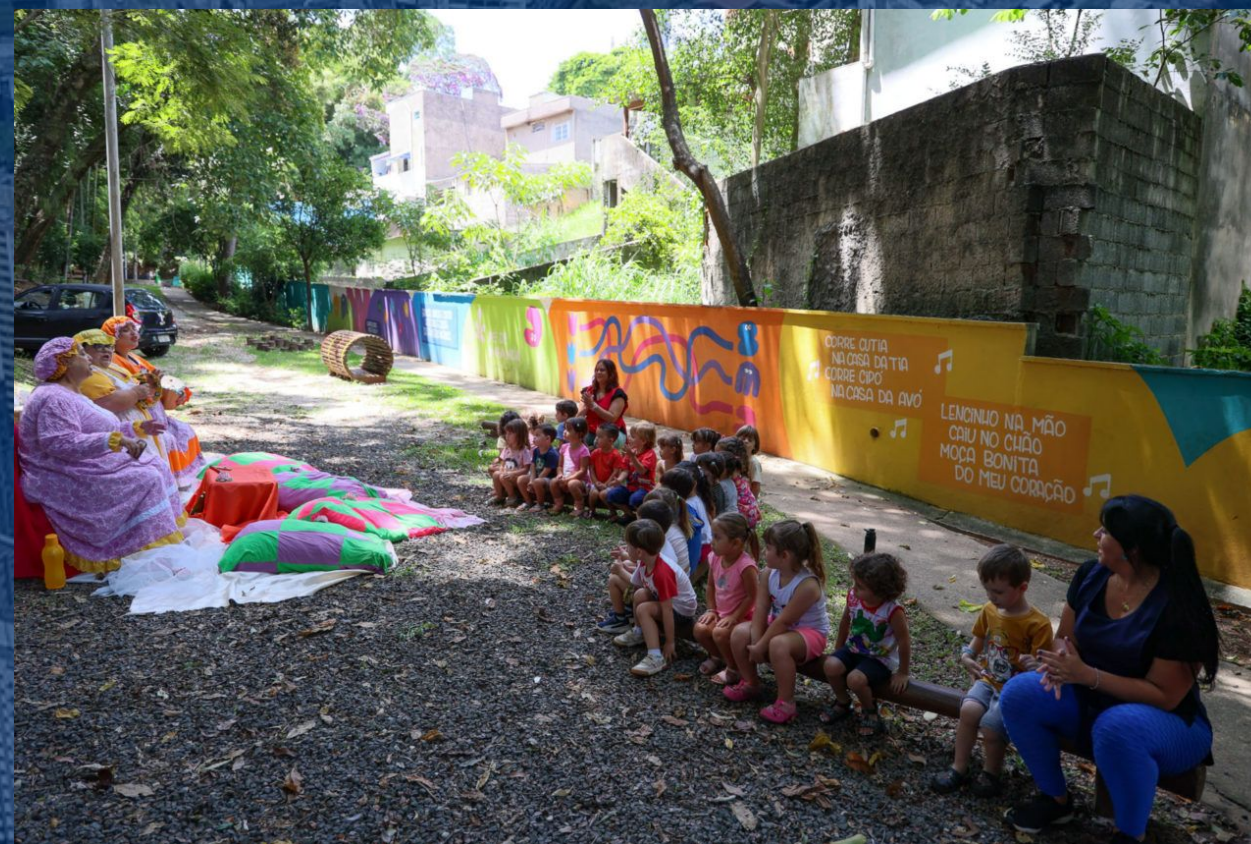
Desemparedamento da escola e ocupação de espaços públicos (praças, centros esportivos, parques) Desemparedamiento de la escuela y ocupación de espacios públicos