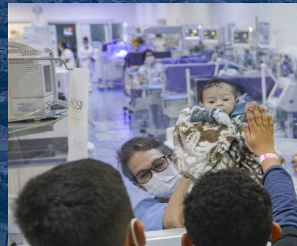
Expedições em lugares da cidade Expediciones en lugares de la ciudad