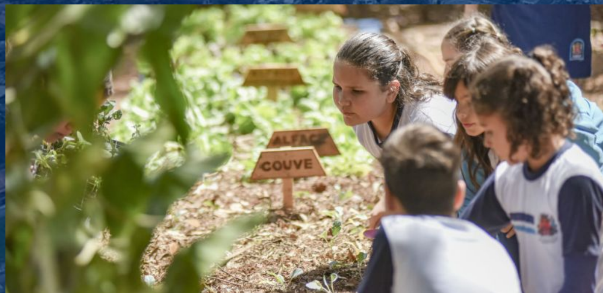
Horta em todas as escolas Huerta en todas las escuelas