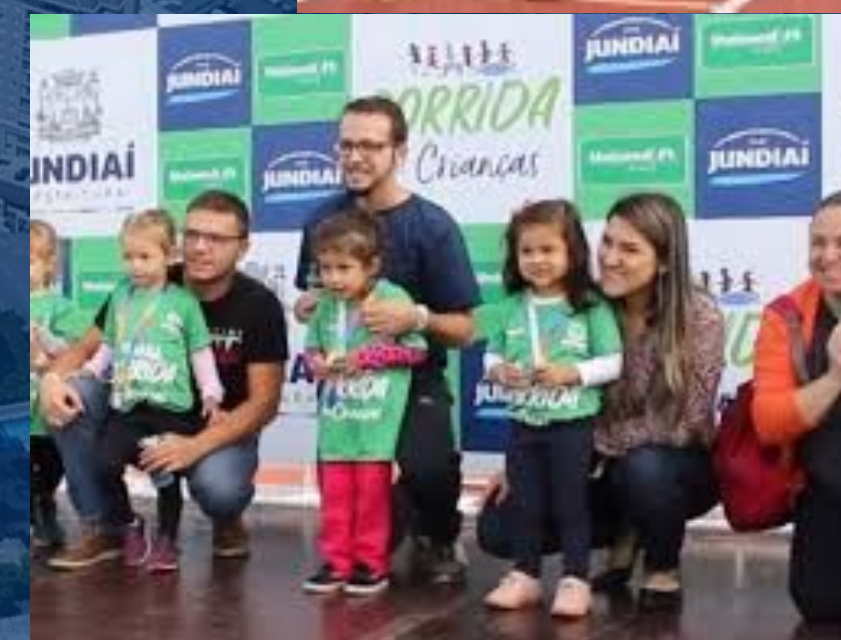
Corrida das Crianças Carrera de los Niños