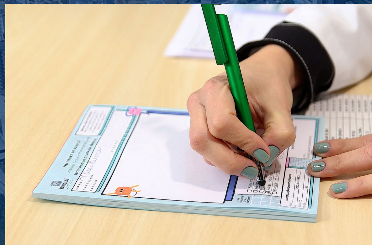
Receituário Lúdico Recetario Lúdico