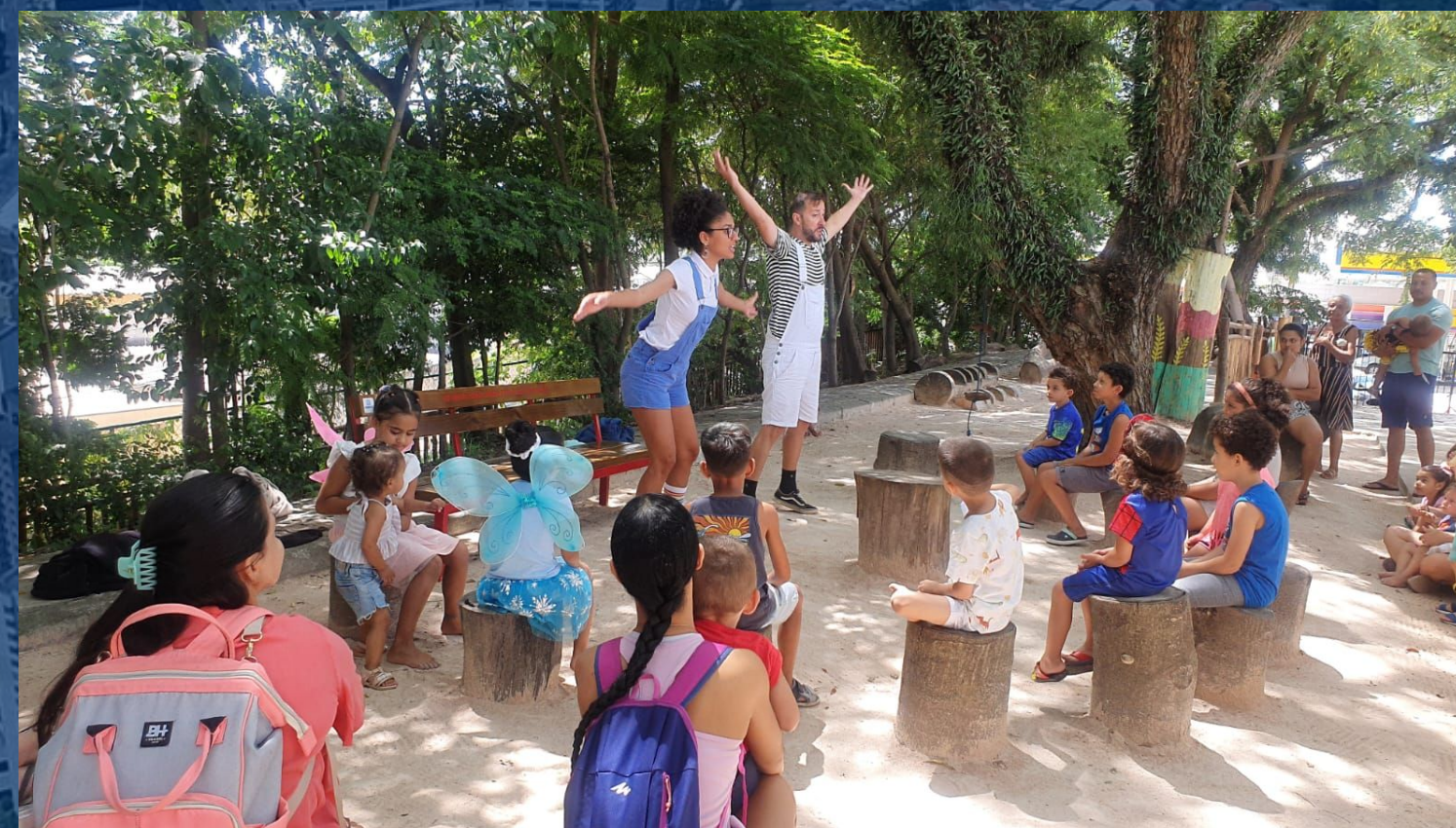
Apresentações Artísticas - Parque Naturalizado Presentaciones artísticas - Parque Naturalizado