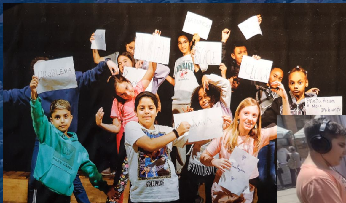
Escuta por diferentes linguagens Escucha a través de diferentes lenguajes