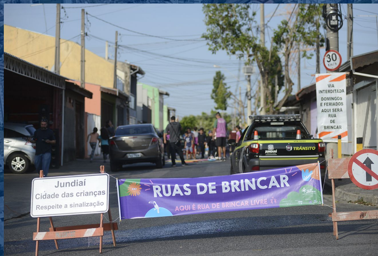
Programa Ruas de Brincar Programa Calles de Juego

Conforme definido pela Lei Municipal nº 9.907/2023 (ver página 05 da edição 5247 da Imprensa Oficial), o Dia do Brincar deverá ser comemorado toda primeira segunda-feira do mês de outubro. 2 de out. de 2023