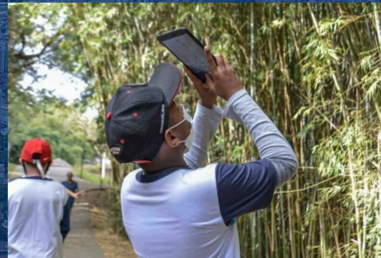
Do digital ao natural Del digital a lo natural