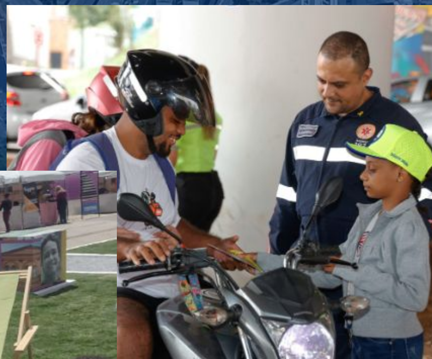
Participação em Campanhas e eventos Participación en campañas y eventos