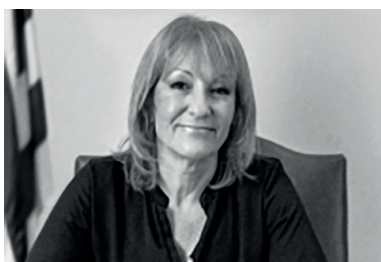
Ing. Carolina Cosse

Intendente Municipal de Montevideo Uruguay