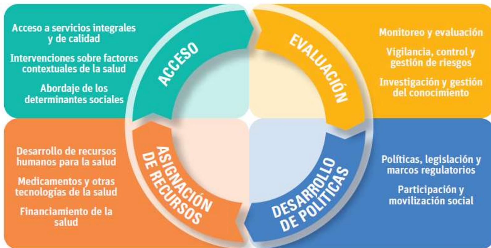
Figura 2. Caracterización de las funciones esenciales de la salud pública en el abordaje integrado de la salud pública