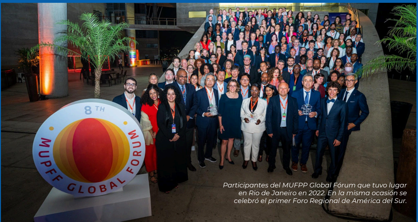
Participantes del MUFPP Global Fórum que tuvo lugar en Rio de Janeiro en 2022. En la misma ocasión se celebró el primer Foro Regional de América del Sur.